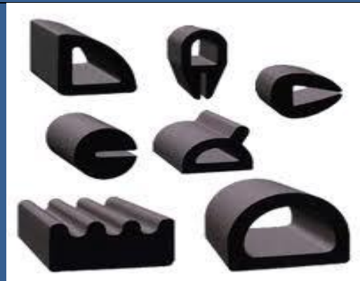
تولید نوار و پروفیل‌های لاستیکی و اسفنجی